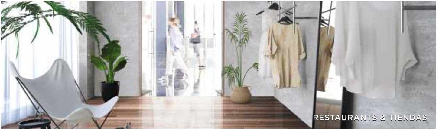
RESTAURANTS & TIENDAS