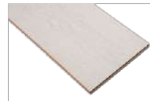
Saten Oak 1205 x 197 mm 2.37 mt2