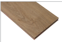
Sahara Oak 1205 x 197 mm 2.37 mt2

Si buscas un piso de aspecto noble que aporta calidez a tu espacio y además resistente, versátil y de fácil mantención, te invitamos a conocer nuestra colección de Artfloor. Las características principales y más destacables de los pisos laminados son su gran resistencia al tráfico, rápida instalación y fácil limpieza. En Feltrex encontrarás una amplia gama de pisos laminados en distintos formatos y colores.