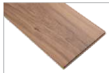
Astana Wnt 1205 x 197 mm 2.37 mt2