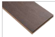
Kuba Oak 1205 x 197 mm 2.37 mt2