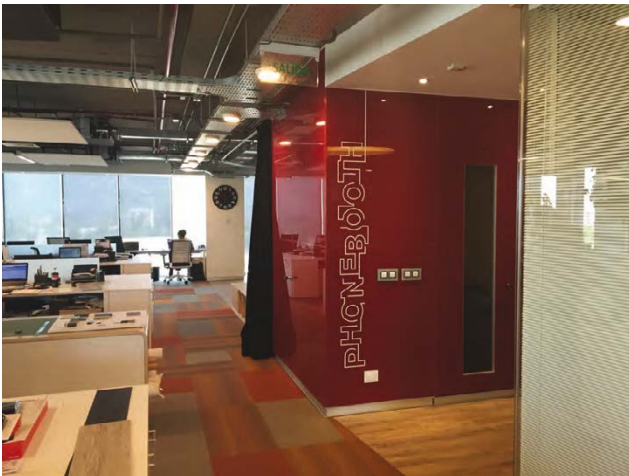
COVERGLASS ROJO Oficinas Contract, Vitacura, Santiago.