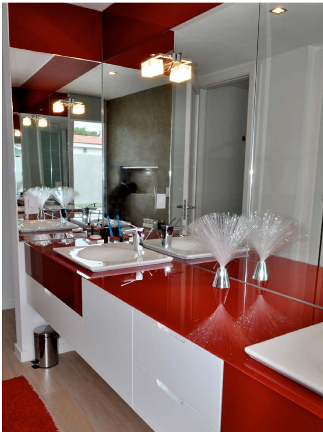
COVERGLASS ROJO Baño casa particular