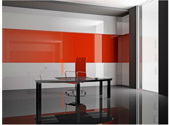
COVERGLASS ROJO Oficina Las Condes

Esta exclusiva versión de Coverglass® se compone de un vidrio (incoloreo o coloreado en la masa) sometido en una de sus caras a un proceso de espejado; a la otra cara se le somete a un satinado, dándole al producto una sensación de profundidad.