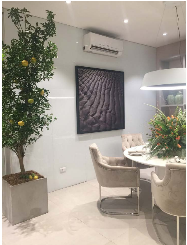
COVERGLASS BLANCO Casa particular