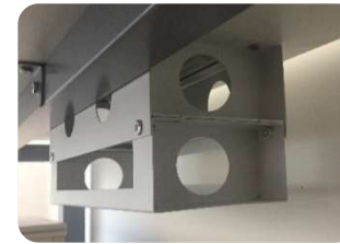
SOCKET BAJO CUBIERTA CON 2 TROQUELES PARA ELECTRIFICACIÓN