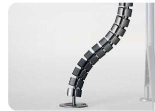
VERTEBRA PARA SUBIDA DE CABLES