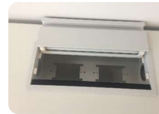
TAPA ABATIBLE PARA CONEXIÓN ELÉCTRICA SOBRE CUBIERTA