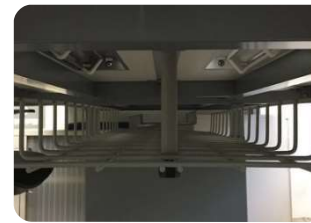
REJILLA PASACABLES BAJO CUBIERTA