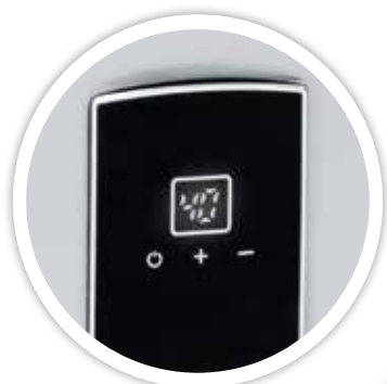
Display digital con selector de temperatura