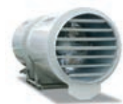
Deflector para aumento de alcance